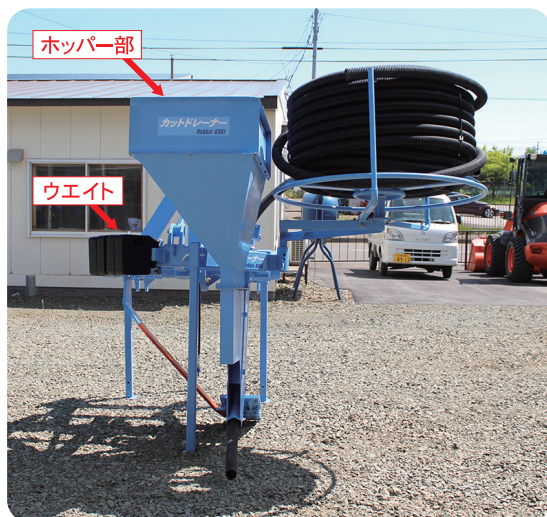
▲ オプション装着時